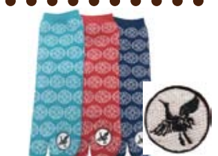
TG226/ 菊文様 ロークルー丈 アクリルパイル 極厚 HOT type★★★★★ 入荷済