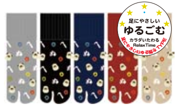
TG606/かまワンぬ ロークルー丈 日本製 極口ゴムゆったり ゆったり度★★★★★ 入荷済