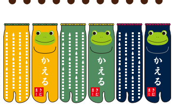
TG246/かえる ロークルー丈 アクリルパイル 極厚 HOT type★★★★★ 入荷済