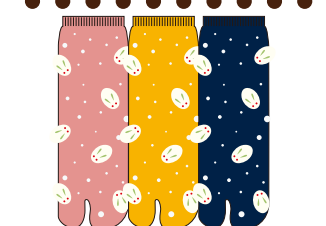
TG236/うさぎ ロークルー丈 アクリルパイル 極厚 HOT type★★★★★ 入荷済