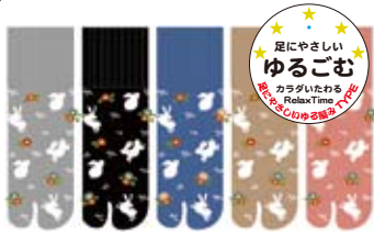
TG586/うさぎ ロークルー丈 日本製 極口ゴムゆったり ゆったり度★★★★★ 入荷済