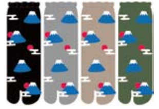
TG566/富士山 ロークルー丈 和柄 日本製 CUTEtype★★★★ 入荷済