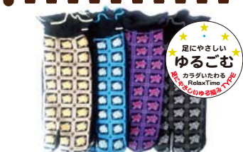
TS804/ ロール巻き総柄 スニーカー丈 口ゴムゆったり CUTE 度★★★★ 入荷済