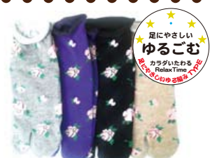
TS794/バラ スニーカー丈 口ゴムゆったり CUTE 度★★★★ 入荷済