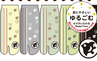
TS326/千鳥 スニーカー丈 和菓子柄 刺繍 CUTEtype★★★★ 入荷済