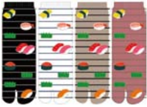
TG536/寿司 ロークルー丈 和柄 日本製 CUTEtype★★★★ 入荷済