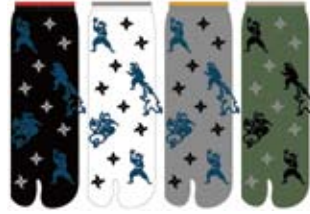
TG556/忍者 ロークルー丈 和柄 日本製 CUTEtype★★★★ 入荷済