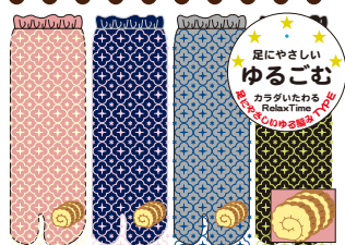
TG416/伊達巻き ロークルー丈 口ゴムゆったり 刺繍 CUTEtype★★★★ 入荷済