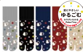
TG596/ねこ ロークルー丈 日本製 極口ゴムゆったり ゆったり度★★★★★ 入荷済