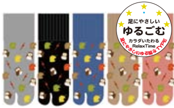
TG576/ふくろう ロークルー丈 日本製 極口ゴムゆったり ゆったり度★★★★★ 入荷済