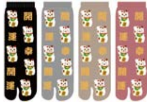
TG546/招き猫 ロークルー丈 和柄 日本製 CUTEtype★★★★ 9/ 未入荷予定